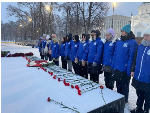
- Зажжение свеч памяти возле мемориалов