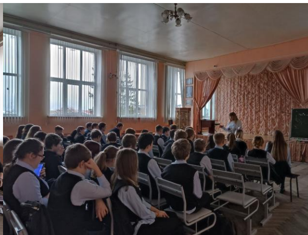
- Раздача муаровых лент